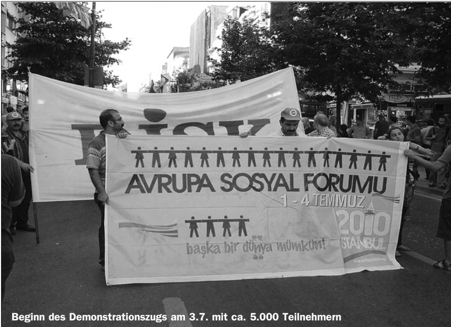
Beginn des Demonstrationzugs am 3.7. mit ca. 5.000 Teilnehmern