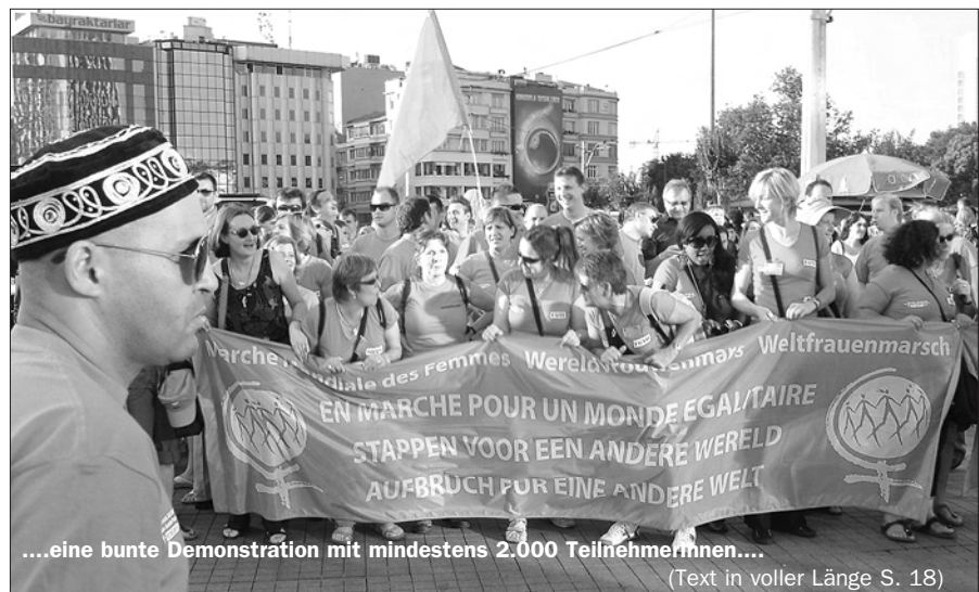
...eine bunte Demonstration mit mindestens 2.000 Teilnehmerinnen....