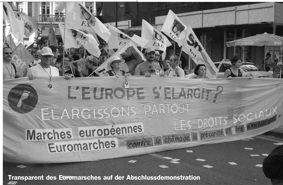
Transparent des Euromarsches auf der Abschlussdemonstration

Was die Koordination des Widerstands angeht, gibt es zwar den genannten europaweiten Termin (den 29.09.2010). Es fehlt aber an zündenden Aktionsideen. Zudem besteht das Problem der abweichenden Terminfestlegung durch die Climate justice-Bewegung. Konsens war aber bei allen Veranstaltungen, dass der ESF ein Kernelement für die europaweite Koordination sein müsse. Es gebe praktisch keine andere Veranstaltung und Organisation, die es schaffe, die vielen linken und ökologischen Bewegungen in Europa zu koordinieren. Da diese Einsicht wohl richtig ist, muss das nächste ESF deutlich effizienter organisiert sein. Es sollte wohl auch nicht erst in zwei Jahren wieder stattfinden, weil die ökonomische und politische Entwicklung viel rasanter verläuft. Immerhin wurde in dieser Richtung auf der Abschlussversammlung ein Zwischentreffen am 23./24.10. bzw. 13./14.11 in Paris beschlossen.